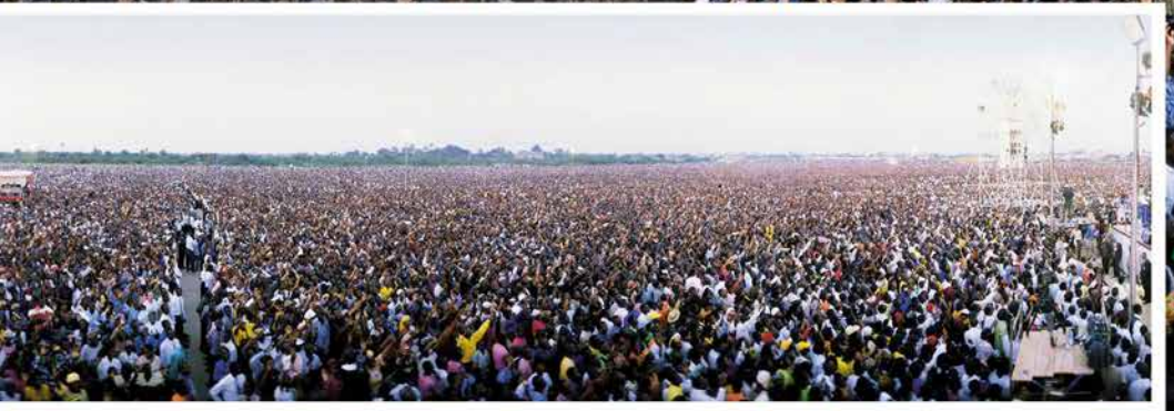
1.6 ՄԻԼԻՈՆ ՄԱՐԴ՝ ՆԵՐԿԱ ՄԵԿ ԾԱՌԱՅՈՒԹՅԱՆ ԼԱԳՈՍՈՒՄ՝ ՆԻԳԵՐԻԱՅՈՒՄ, 2000