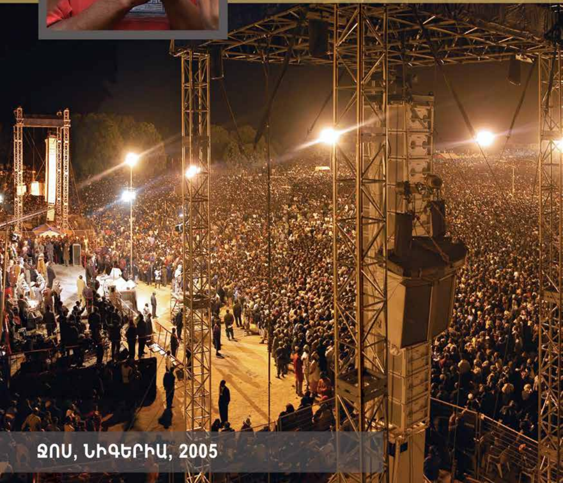
ԶՈՍ, ՆԻԳԵՐԻԱ, 2005